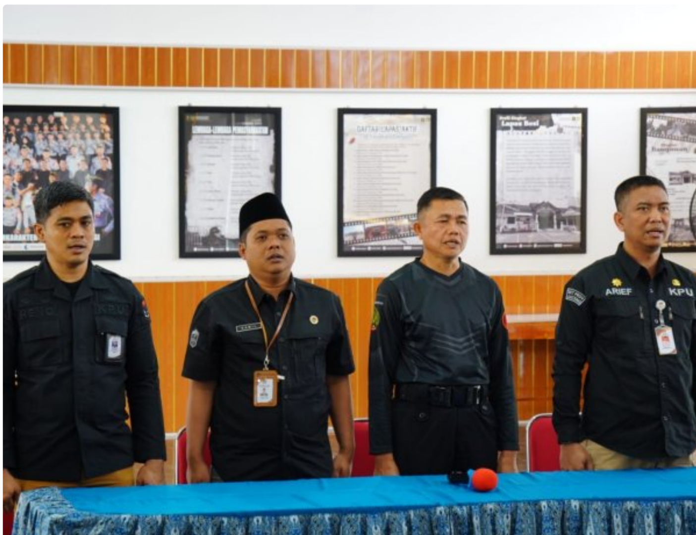
Lapas Besi Gelar Rapat Bersama KPU Provinsi Jawa Tengah, Bahas Apa Saja?

CILACAP - Lembaga Pemasyarakatan Kelas IIA Besi Nusakambangan menggelar rapat koordinasi bersama Komisi Pemilihan Umum (KPU) Provinsi