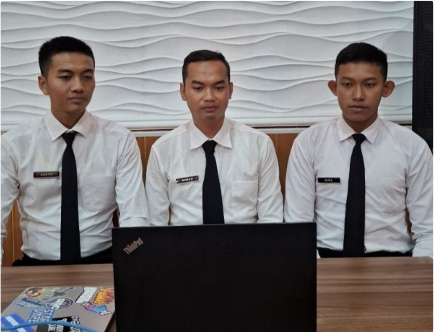
Bersiap Jadi Pelayan Masyarakat, CPNS Lapas Besi Hadiri Pembukaan Latsar

CILACAP – Sebanyak 3 Calon Pegawai Negeri Sipil (CPNS) Lembaga Pemasyarakatan Kelas IIA Besi mengikuti Pembukaan Pelatihan Dasar CPNS